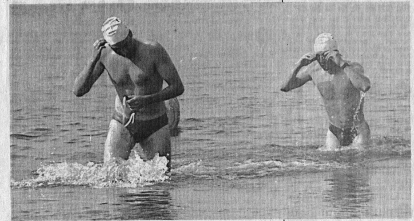
La sortie de l'eau toujours spectaculaire.