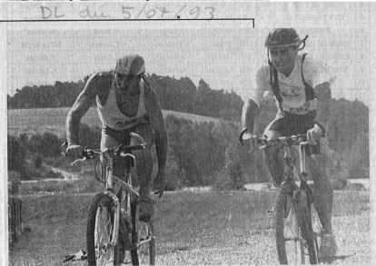
Il faut se dépêcher pour enchaîner avec le VTT.