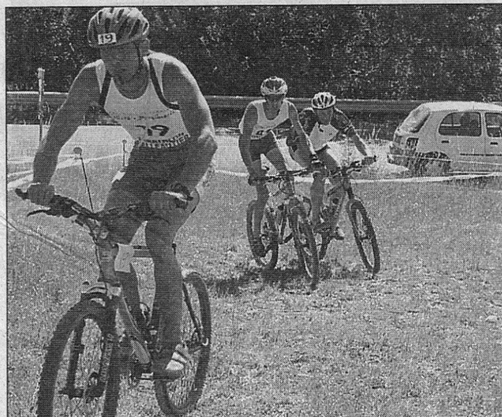
En VTT ou dans l'eau : la lutte est serr e.