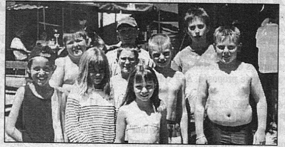
Les "grands" et les plus jeunes de 12 ans et moins se sont mesurés pour un mini-terathlon devenu tradition.

assurer la relève il faut s'occuper des plus jeunes. C'est bien ce que les organisateurs du terathlon de Pelleautier ont compris, proposant aux minimes et moins de se faire les dents sur un parcours qui, toute proportion gardée demande des qualités sportives certaines. En tout cas même sérieux