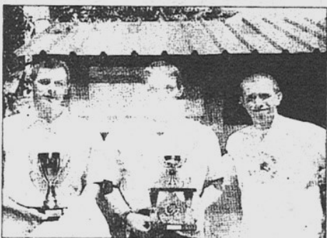
La 12 e édition de ce téraathlon a donné entière satisfaction aux athlètes qui se sont régalés sur un parcours sympa mais "costaud".

A Pelleautier, c'est un bon vieux fusil de chasse qui donne le départ pour les 500 mètres de nage. Timing respecté, 9 h 30, on joue des coudes et on s'élanche dans une eau à la température idéale. A mi-parcours déjà, les écarts se creusent, les nageurs de tête mettent les brassées doubles pour gagner de précieuses secondes. Dans ce mélange hétéro-